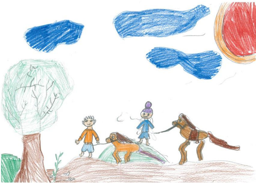
Odrija Baklāne, Latvia

Ljudi mu odgovore: „Nije li te sram što si pretrpao to jadno magarca?“