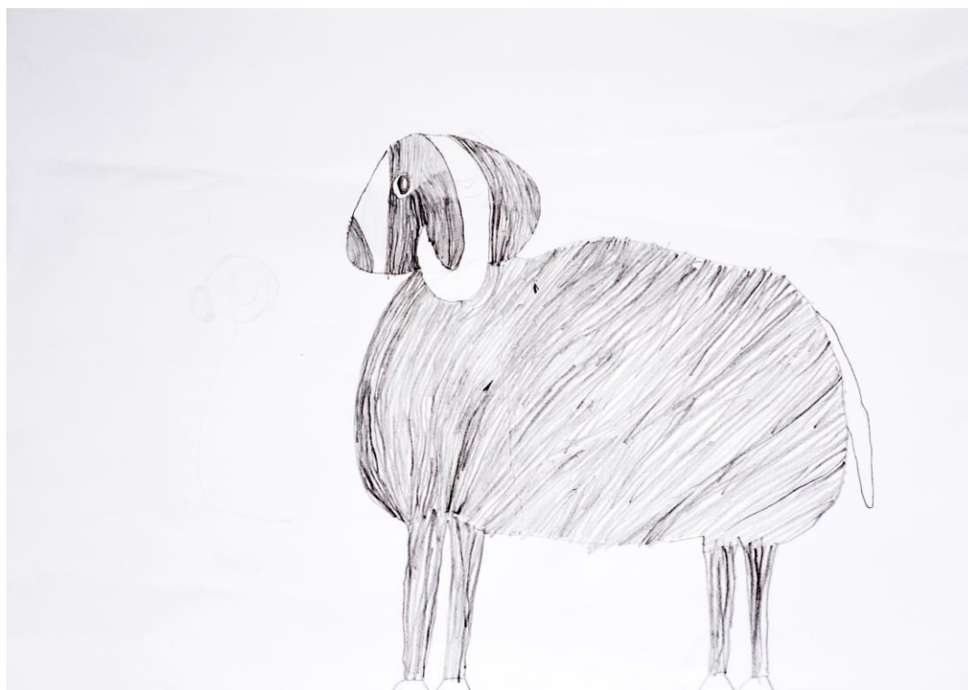
OŠ Josip Pupačić, Omiš, Hrvatska

A kad tamo - nasred Cetine leži crni veliki ovan.