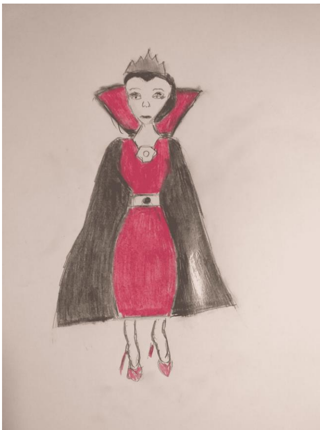
Mala filozofija, Hrvatska

Ona je čuvala sirotinju, a kažnjavala je silu i nepravdu. U Velebitu imala je ona svoje vilinske dvore. Ponekad je silazila u plodne ravnice Ličkoga polja i Gacke doline gdje je svojom dobrotom usrećivala narod.