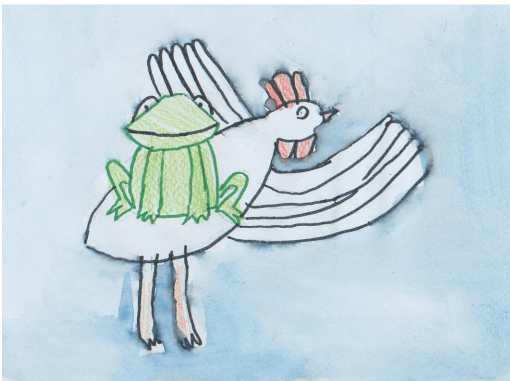
OŠ Luka, Sesvete, Hrvatska

Žabica odgovori: „Doći ću, ali mi moraš poslati bijelog pijetla na kojem ću dojahati“.