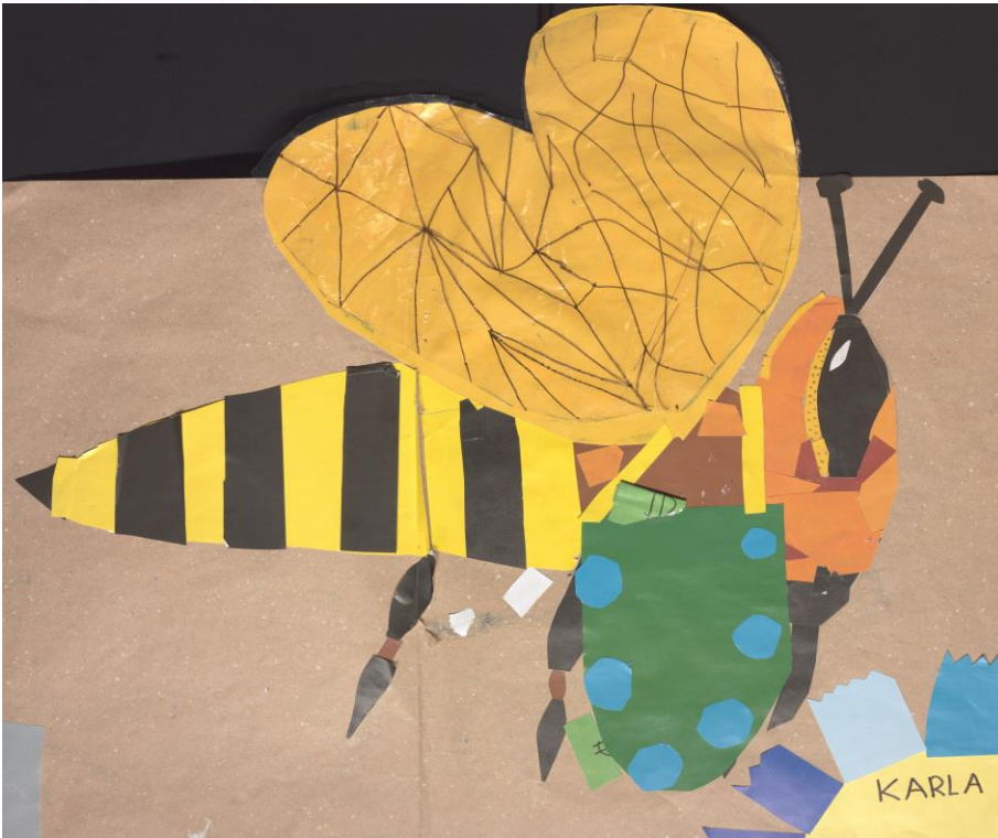
Karla OŠ Retkovec, Hrvatska

Kad je svanuo dan, na vrhu brda je stajala prekrasna građevina.